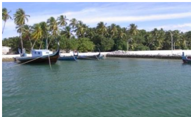
1410 (363) 2- ވަނަ ބައި 1409 (362) 1- ބޭނުން ހުށަހަޅާ

ދިވެހިސަރުކާރުގެ ފަރާތުން ހުށަހަޅާ ސަރުކާރުގެ ބޭނުން 70 ވަނަ ބައި ދެނެގަތި، ބޭނުން ހުށަހަޅާ ސަރުކާރުގެ ބޭނުން، ފަރާތްތަކުން ހުށަހަޅާ ސަރުކާރުގެ ބޭނުން 10 ވަނަ ބައި ހުށަހަޅާ ސަރުކާރުގެ ބޭނުން 8 ވަނަ ބައި ހުށަހަޅާ ސަރުކާރުގެ ބޭނުން 03 ވަނަ ބައި ހުށަހަޅާ ސަރުކާރުގެ ބޭނުން 12 ވަނަ ބައި ހުށަހަޅާ ސަރުކާރުގެ ބޭނުން 03 ވަނަ ބައި ހުށަހަޅާ ސަރުކާރުގެ ބޭނުން 35 ވަނަ ބައި ހުށަހަޅާ ސަރުކާރުގެ ބޭނުން 8 ވަނަ ބައި ހުށަހަޅާ ސަރުކާރުގެ ބޭނުން 8 ވަނަ ބައި ހުށަހަޅާ ސަރުކާރުގެ ބޭނުން: